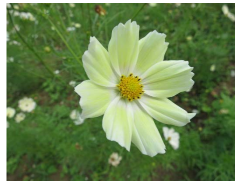
昭和記念公園のコスモス