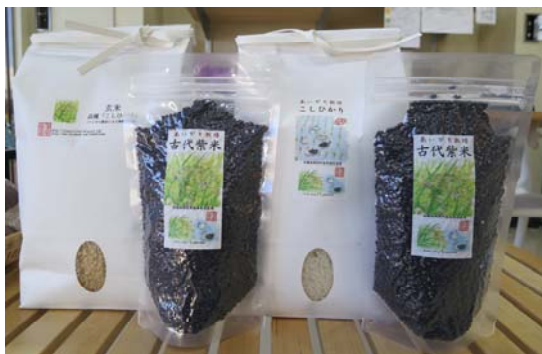
古代米 300g ¥630 コシヒカリ 2 kg ¥1890

他企業とのコラボによる多摩モノレールワイン列車のお弁当で使用した古代米とコシヒカリ（白米・玄米）を販売中。噛めば噛むほど味が出る古代米。皆さんもおひとついかがですか？