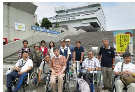
東京江戸博物館へ遠足