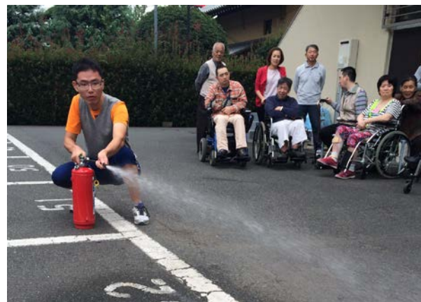
キッチンさかえ サポーターズさかえ 合同の避難訓練